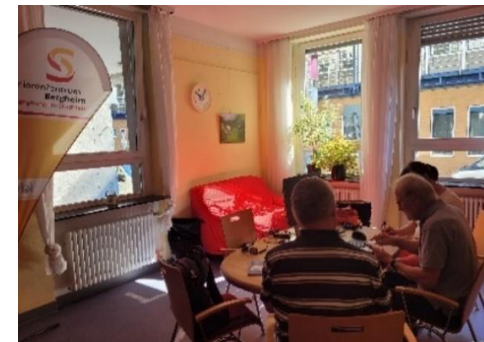
( : Beratung am 06.07.2023).

Es scheint mir nicht unwichtig, wenn im Alter (ich werde dieses Jahr 85) der Kopf etwas zu tun bekommt. Damit komme ich hier bei den vielen unterschiedlichen Fragen und unterschiedlichen Geräten wirklich nicht zu kurz.