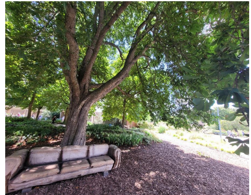
Fotoimpressionen- BUGA 23: Schattensitzgelegenheit im Luisenpark