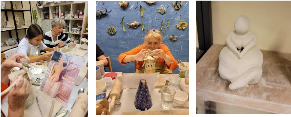
(Impressionen - Kreativgruppe am 03.08.2023)

Der Kreativgruppe, die sich immer donnerstags trifft, gehen die Ideen nicht aus. Es gibt immer wieder neue Inspirationen, neue Motive und Ideen, die umgesetzt werden möchten. Muse in der fast „meditativen“ Handarbeit finden, der Fantasie freien lauf lassen und im Tun versinken... dabei Humor und Geselligkeit nicht zu kurz kommen lassen. Diese Gemeinschaft verbindet und begeistert unsere Kreativgruppe und bereichert unsere offene Begegnungsstätte mit einzigartigen Ideen und Kunstwerken.