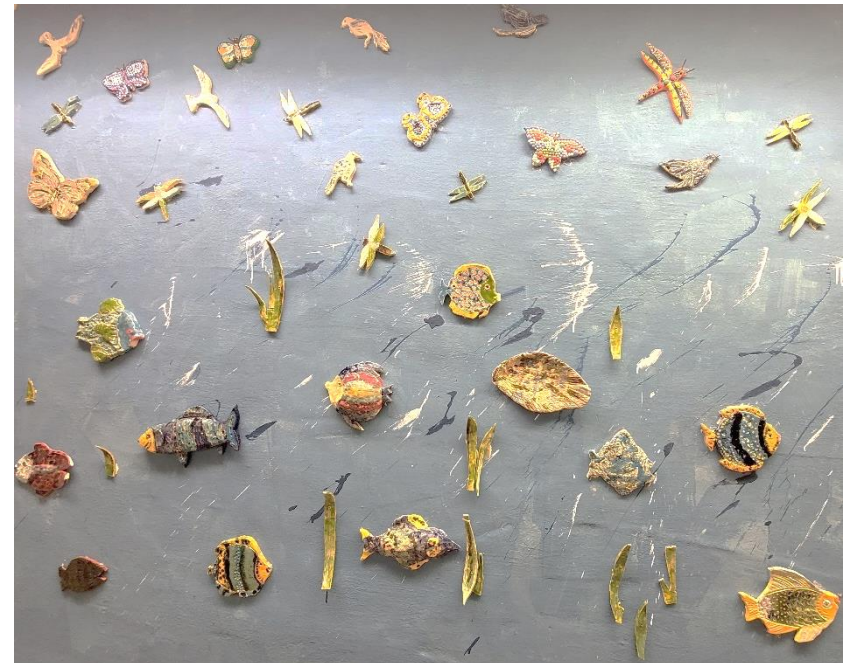
Fotoimpressionen: Kreativraum im SeniorenZentrum Bergheim

SeniorenZentrum Bergheim Begegnung im Stadtteil