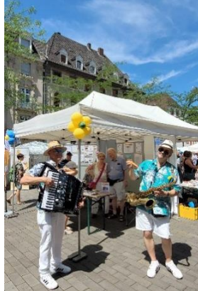
(Impressionen vom 08.07.2023)