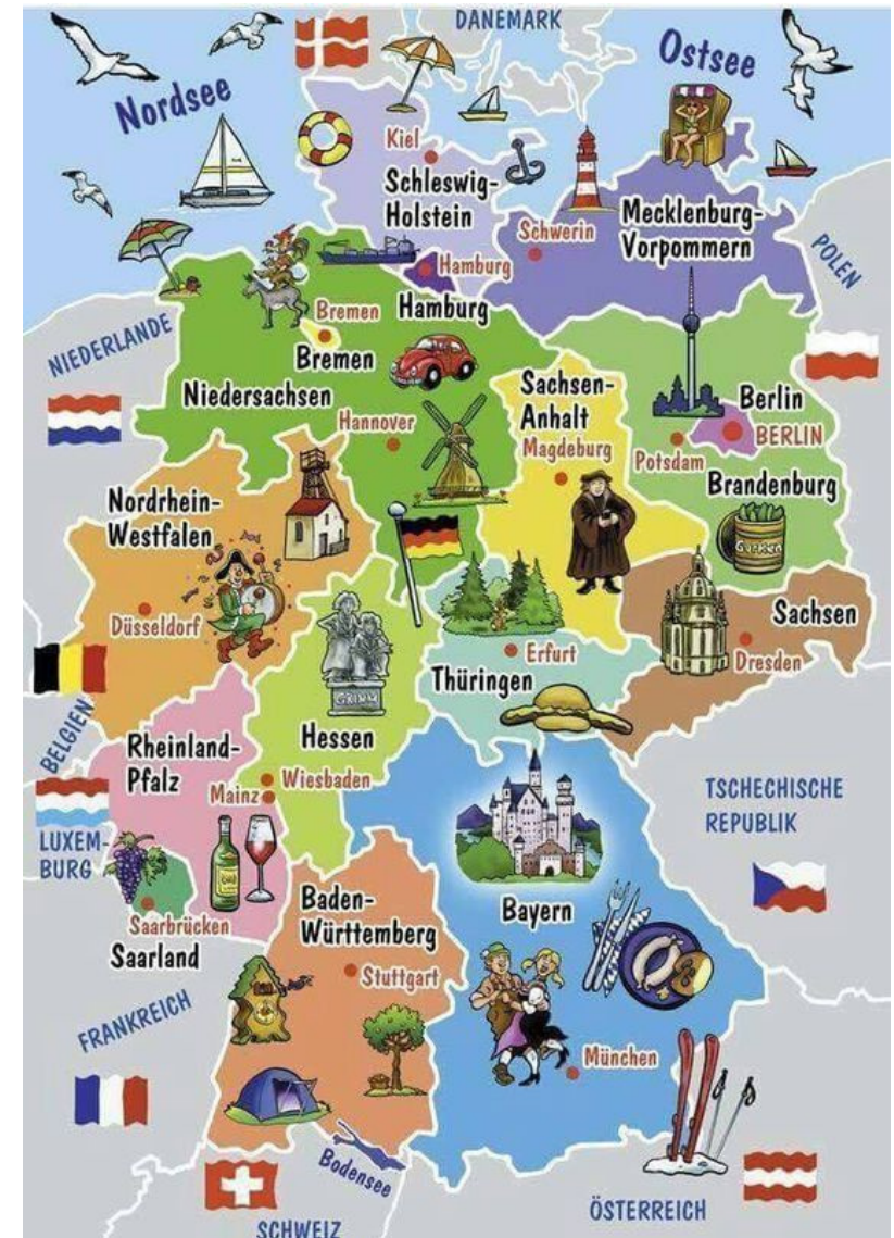
Deutschlandkarte mit den Bundesländern und deren Hauptstädte

Beruf, Kartoffel, Blitz, Schokolade, Erlebnis, Spargel, Flasche, Tochter, Frühling, Verkehrsschild, Gefahr, Zahnpasta, Gesetz, Fischernetz, Getreide, Holzkohle, Hunger, Rakete, Maschine, Knopf, Lexikon, Urlaub,